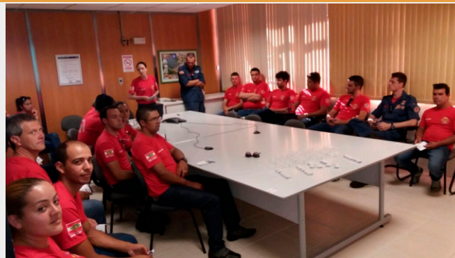
Alunos do Curso Avançado de Atendimento a Emergências conheceram os sistemas preventivos contra incêndio existentes na Usina

A visita dos alunos faz parte da estratégia da BAESA de divulgar a Usina Hidrelétrica Barra Grande para a comunidade, destacando ações e projetos que tornaram o empreendimento um exemplo de valorização do binômio “desenvolvimento