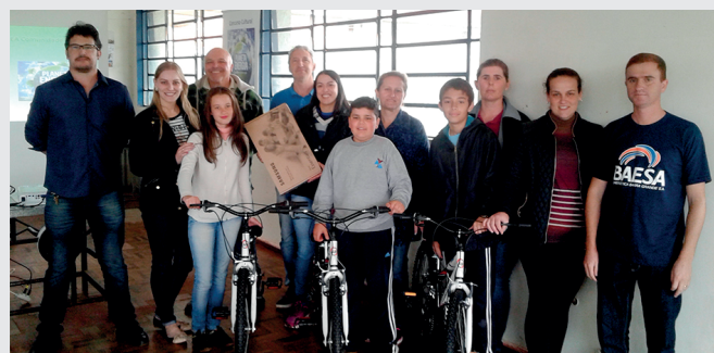
Vencedores do Concurso Cultural em Pinhal da Serra/RS