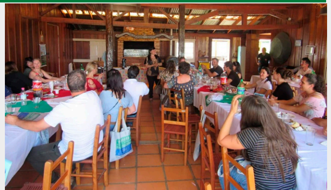
Integrantes dos CCCs de Santa Catarina e do Rio Grande do Sul participaram de um almoço de confraternização em Vacaria/RS

Além da avaliação das reuniões promovidas durante o ano, os participantes definiram que, a partir de 2018, serão promovidas cinco reuniões por ano. Também ficou definido que a indicação de projetos de educação ambiental pelos CCCs será