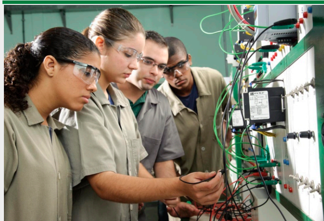
Curso Técnico em Eletrotécnica vai formar 25 jovens da região

Até o dia 23 de fevereiro, jovens interessados em conseguir uma formação profissional poderão fazer a inscrição para o processo seletivo do Curso Técnico em Eletrotécnica, oferecido gratuitamente pela BAESA e a ENERCAN, em parceria com o Instituto Alcoa e a CPFL Energia.