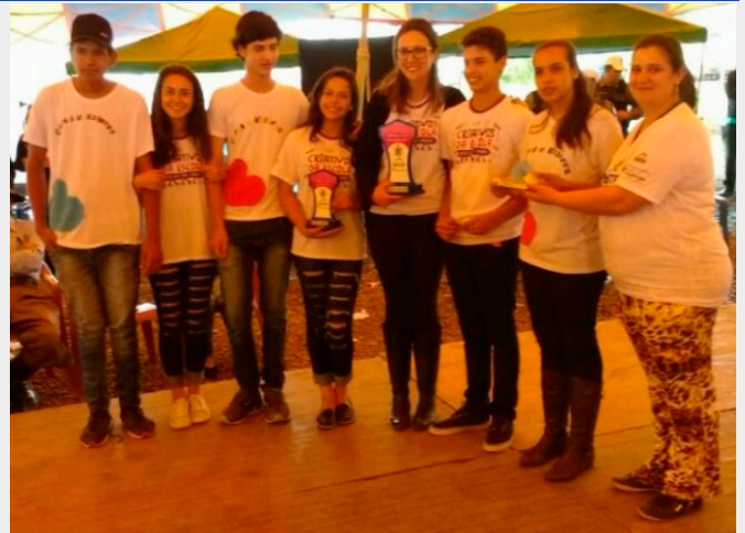
Esmeralda/RS foi um dos municípios que contou com o Projeto PVE

As ações desenvolvidas em 2017 contemplaram ainda a realização do INDIQUE (Indicadores da Qualidade na Educação). Com base nas respostas obtidas, as cidades dispõem de informações relevantes para aprimorar o nível de educação de cada uma das cidades. O INDIQUE é uma ação educativa idealizada pelo MEC (Ministério da Educação) com o objetivo de avaliar a qualidade do ensino nas escolas brasileiras.