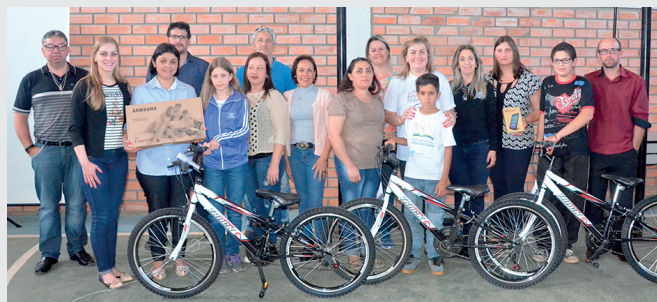
Vencedores do Concurso Cultural em Anita Garibaldi/SC